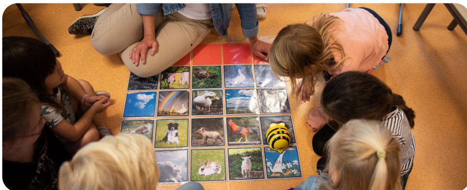
Onderwijstijd verdeeld naar vakken